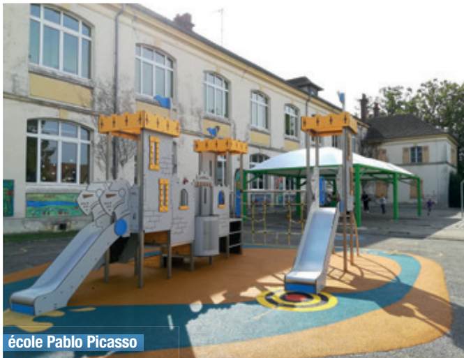
école Pablo Picasso