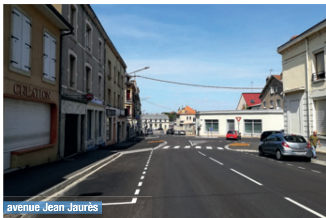
avenue Jean Jaurès