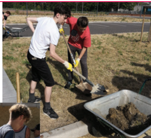
création d'un accès Espace Rachel Foglia

Cet été encore, ce sont près de 120 adolescents qui ont apporté leur aide pour ces divers travaux : ramassage des déchets avec l'association JCJ Nature et Environnement, entretien du marais de Droitaumont avec le Conseil Départemental, préparation de la fête de la grotte avec le comité de quartier de Moulinelle, création d'un chemin à l'Espace Rachel Foglia et nettoyage de l'ancien canal d'exhaure de la mine avec le comité de quartier de Droitaumont... Une multitude de réalisations encadrées par un animateur et des bénévoles associatifs ou habitants des quartiers qui favorisent le lien social et intergénérationnel. Chaque jeune reçoit un chèque d'un montant de 65€ à valoir chez les partenaires locaux.