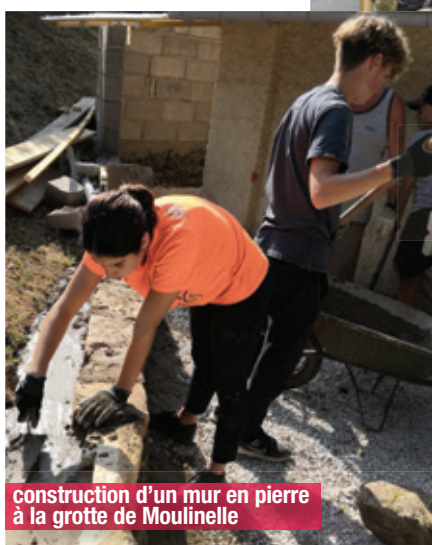
construction d'un mur en pierre à la grotte de Moulinelle