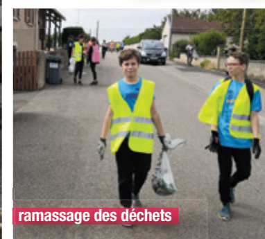
ramassage des déchets