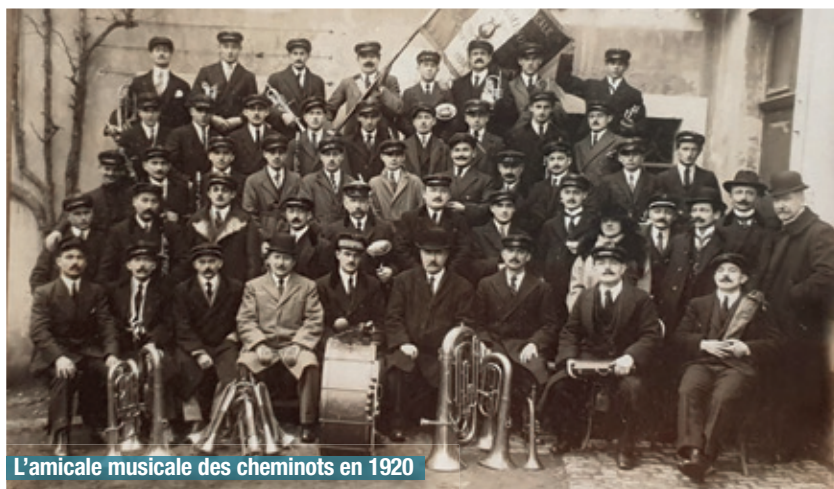
L'amicale musicale des cheminots en 1920