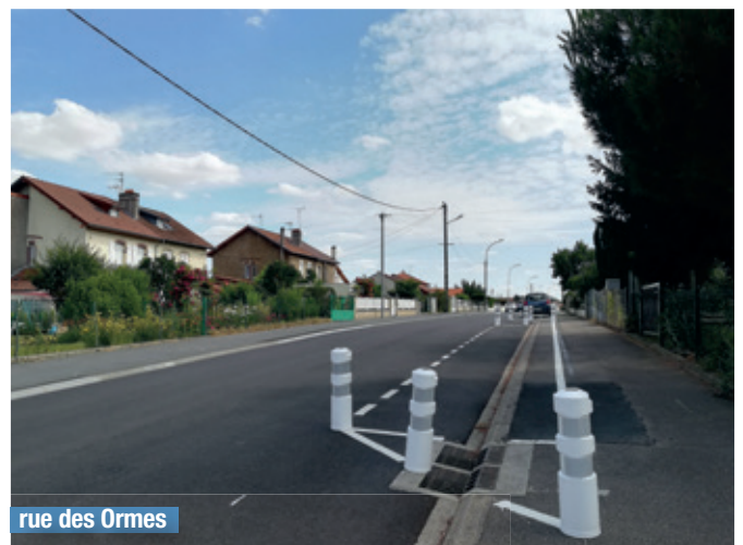
rue des Ormes