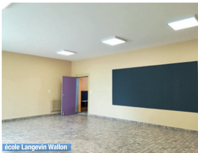
école Langevin Wallon

Jeunesse : la façade de l'école élémentaire Langevin Wallon a été refaite et une salle de classe ULIS a été créée.