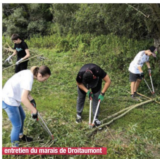
entretien du marais de Droitaumont