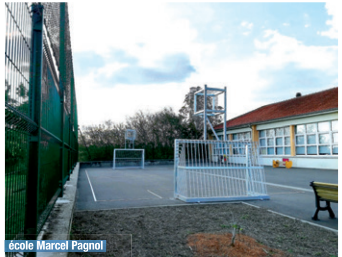
école Marcel Pagnol