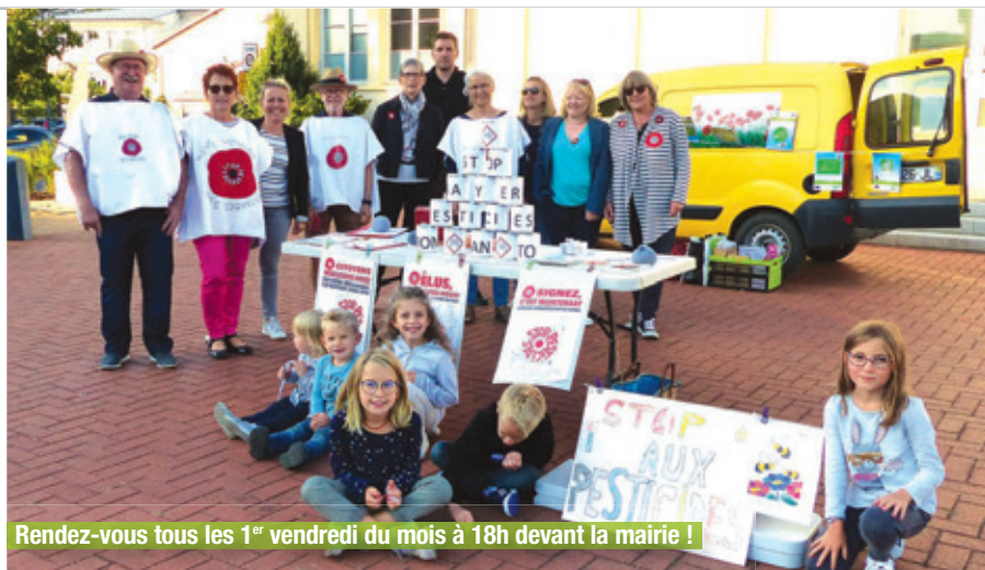
Rendez-vous tous les 1 er vendredi du mois à 18h devant la mairie !

Lors de cet Appel des 100, nous avons consulté l'instance de l'AMAP (Association pour le Maintien de l'Agriculture Paysanne) du Jarnisy qui a décidé de rallier ce mouvement national et avons créé un relais local. Nous organisons un rassemblement mensuel, le 1 er vendredi du mois, à 18h devant la mairie de Jarny, pour rendre visible le mouvement, faire connaître les problématiques liées aux pesticides chimiques. Ils provoquent des cancers, des maladies de Parkinson, des troubles psychomoteurs chez les enfants, des infertilités, des malformations à la naissance. Le tiers des oiseaux a disparu en quinze ans, la moitié des papillons en vingt ans ; les abeilles et les pollinisateurs meurent par milliards ; les grenouilles et les sauterelles semblent comme évanouies. Et nous appelons à signer un appel national contre ces pesticides. Notre but est de sensibiliser à leurs dangers et