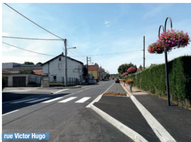
rue Victor Hugo