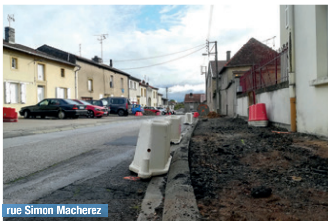
rue Simon Macherez